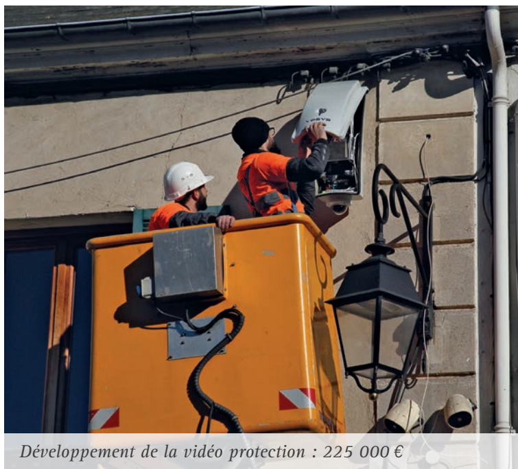
Développement de la vidéo protection : 225 000 €

D epuis le début des années 2010, les collectivités locales font face à un contexte budgétaire contraint. D'une part, l'État a gelé puis baissé le montant des dotations qu'il verse aux communes et intercommunalités. D'autre part, les dépenses obligatoires des collectivités augmentent (Police Municipale, gestion des passeports et Cartes Nationales d'Identité, cotisations d'assurances, entretien du patrimoine, etc.).