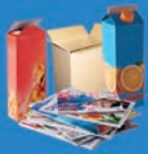
Papiers, emballages et briques en carton