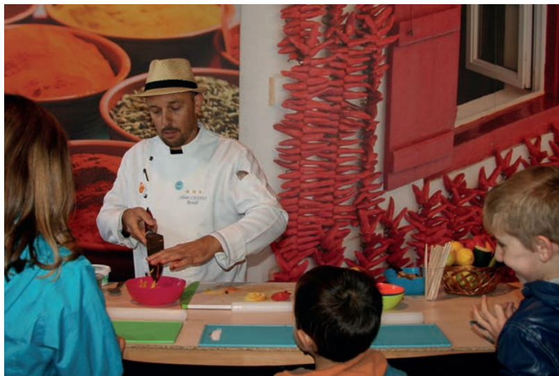
Les « Chefs » de Restolib' sur le Pôle Gastronomie