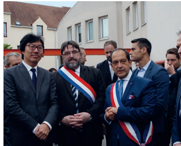
Après l'inauguration, les élus visitent la Foire.