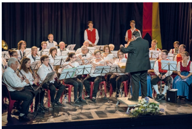
Soirée de gala du 25 e anniversaire du jumelage avec Freising