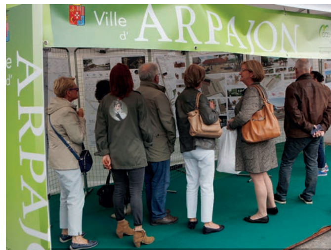
Avant-première sur le stand de la Ville présentation des 4 projets pour Le Cœur de Ville