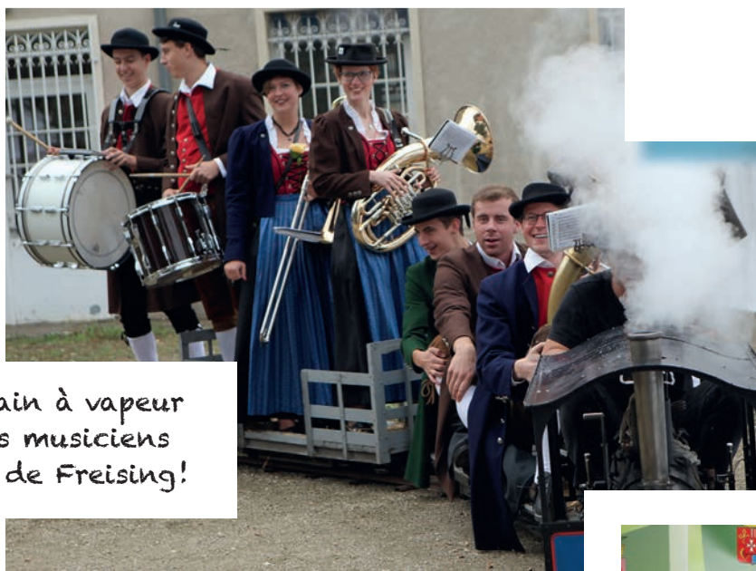
Le petit train à vapeur inspire les musiciens allemands de Freising!