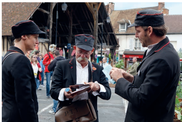
«Le Facteur d'amour»... L'instant épistolaire de la Foire!