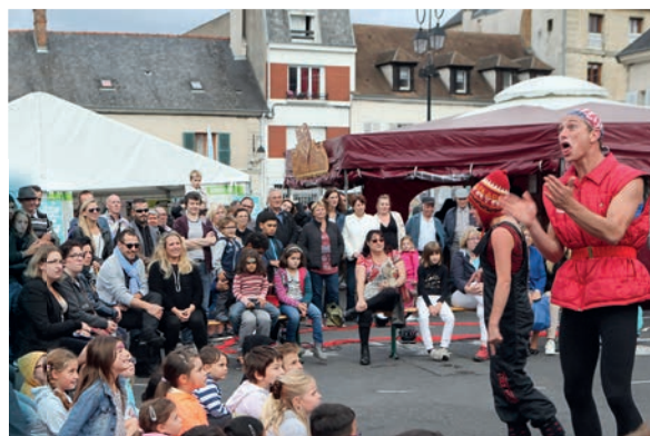
Rire et adresse avec Cirk Biz'Art!