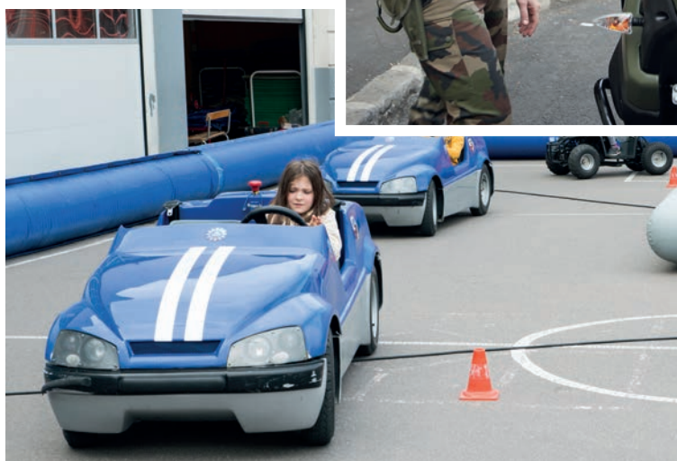
Apprendre dès le plus jeune âge... Avec le CISP sur le Forum Sécurité routière!