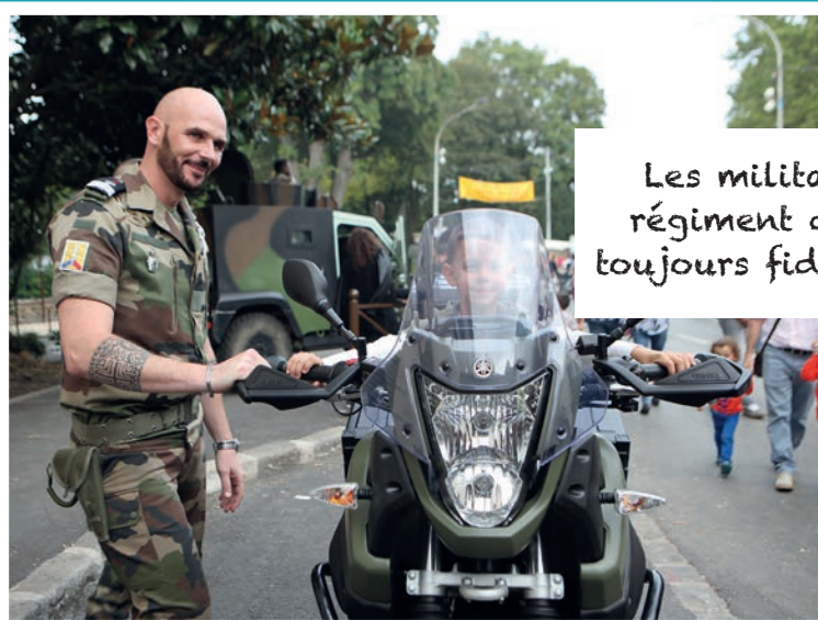
Les militaires du 121 e régiment du train sont toujours fidèles à la Foire