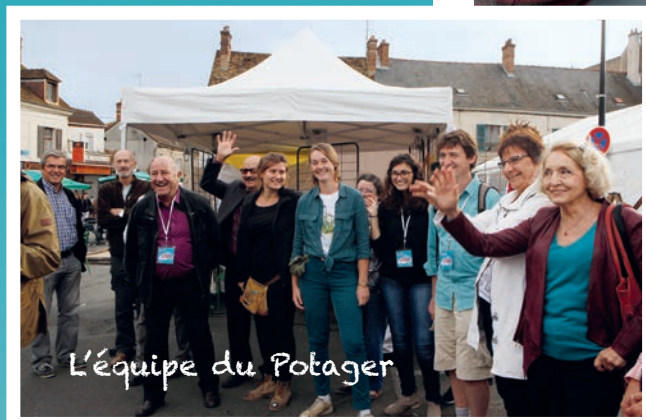
L'équipe du Potager