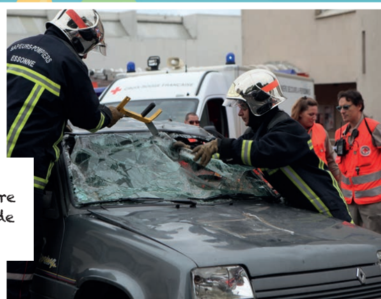
Démonstration des Sapeurs-Pompiers du centre de secours d'Arpajon et de la Croix Rouge.