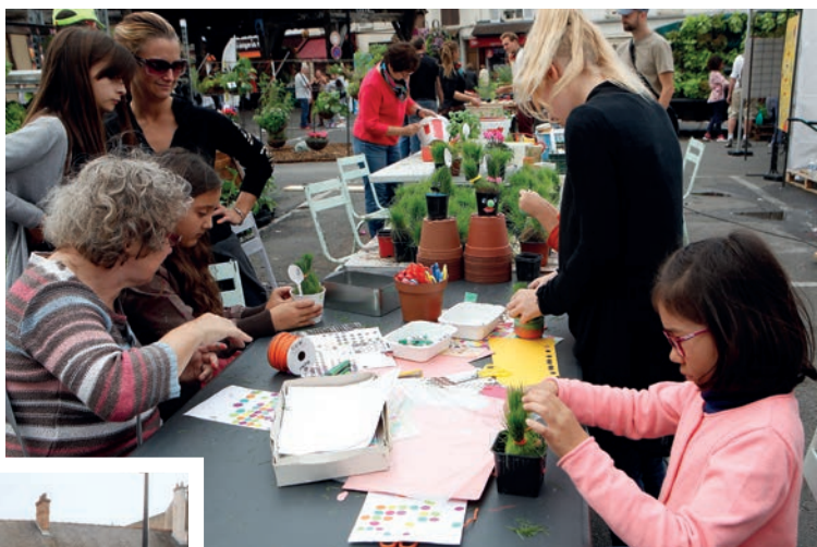
«Sous les pavés... Le potager» un beau succès pour les Ateliers du 29!