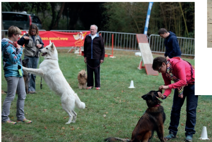
Au Pôle canin, maîtres et chiens travaillent en s'amusant...

Pour la 1 ère fois départ à Arpajon de la Vald'Orgienne organisée par Cœur d'Essonne Agglomération avec plus de 1500 participants!