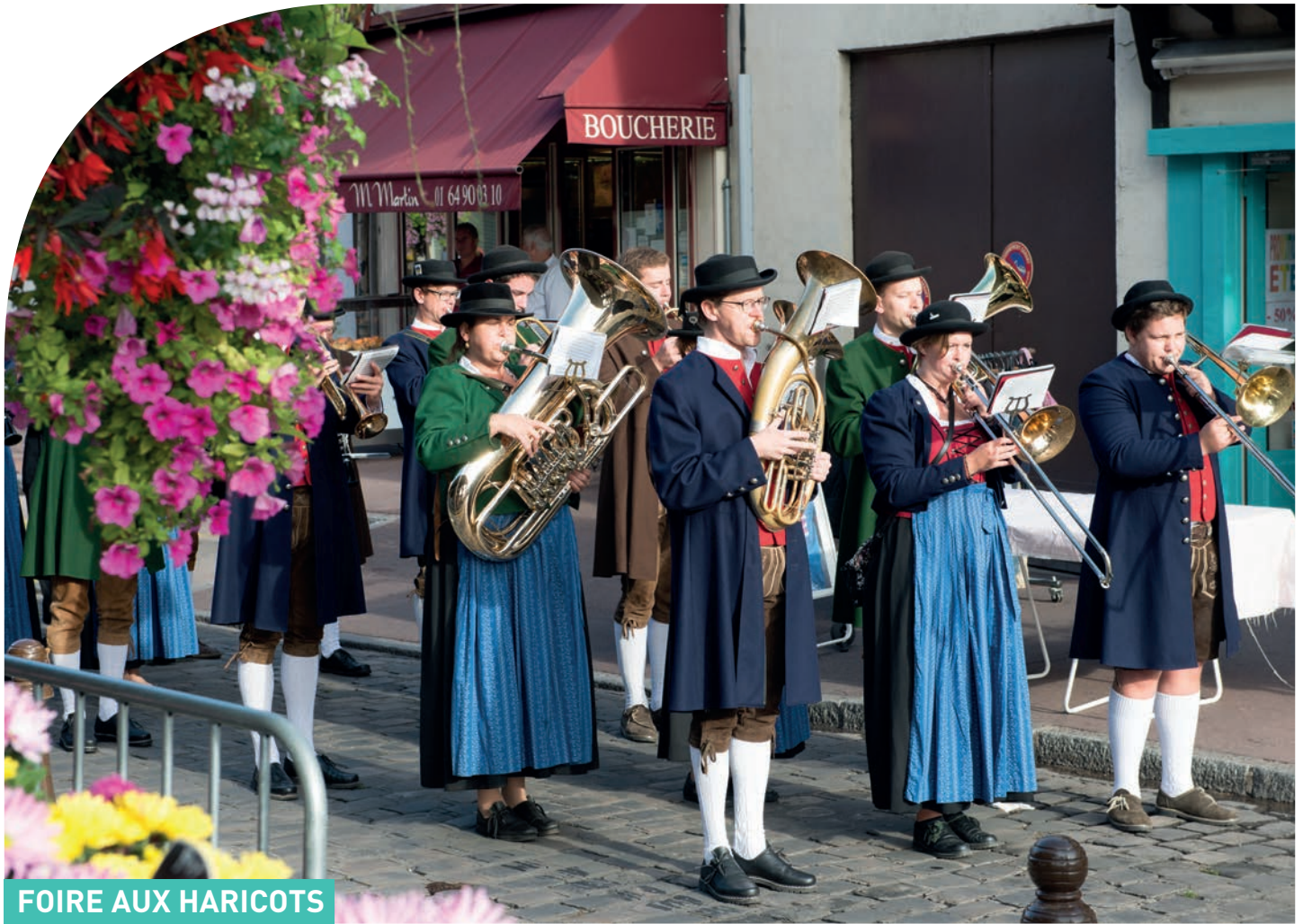
FOIRE AUX HARICOTS