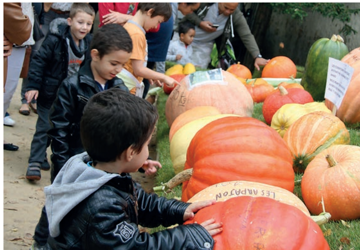
Les légumes du Pôle rural... comme dans les dessins animés!