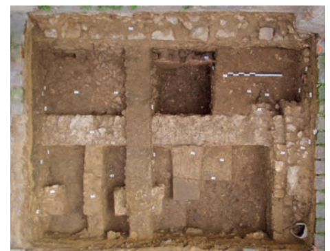
Vue verticale du sondage réalisé Place de Châtres

Afin de mesurer la résistance des matériaux retenus pour les aménagements du Cœur de ville (effets du temps, résistance mécanique, couleur) et d'évaluer les modalités d'entretien, un échantillon de parquet granit d'environ 2m 2 a été implanté à l'entrée de la cour de l'hôtel de ville. Ce test en conditions réelles, permet d'avoir un premier aperçu du futur parvis qui sera composé d'un ensemble de lattes de pierre associant des veines banches et grises. La commune a de plus procédé à de nombreuses marques de peintures au sol dans les rues du centre-ville afin de repérer très précisément la position des réseaux. Une obligation pour que les entreprises qui répondront aux appels d'offres de travaux