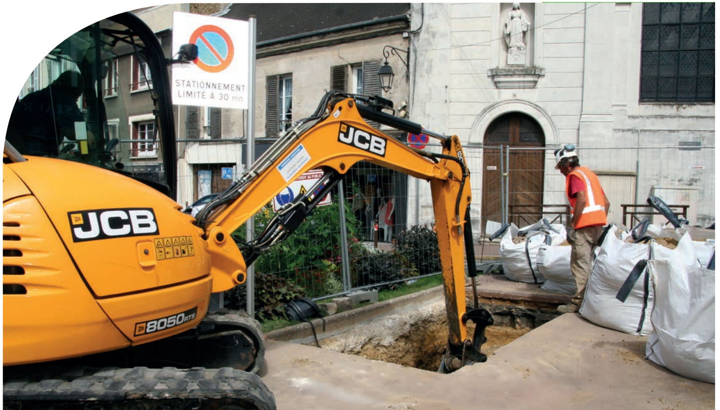
Sondages archéologiques devant la table du Maroc - Grande Rue